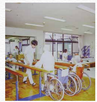
当時のリハビリ風景

2013年に開院した御所南リハビリテーションクリニックは、脳卒中や神経疾患のリハビリテーションを通院で提供する数少ないクリニックです。大病院や急性期病院の医師約20名が診察にあり、生活期の個性が高い要望に応えています。2018年には京都近衛リハビリテーション病院を開院。入院期間を「生活」と捉えて空間、食事やアメニティなどの生活関連サービス、コンシェルジュの配置など総合的な満足度を高められる取り組みを推し進めました。これらの実績を糧に、新病院の構想を具体化します。今後も、構想具体化の進捗に応じて最新の情報をお届けします。