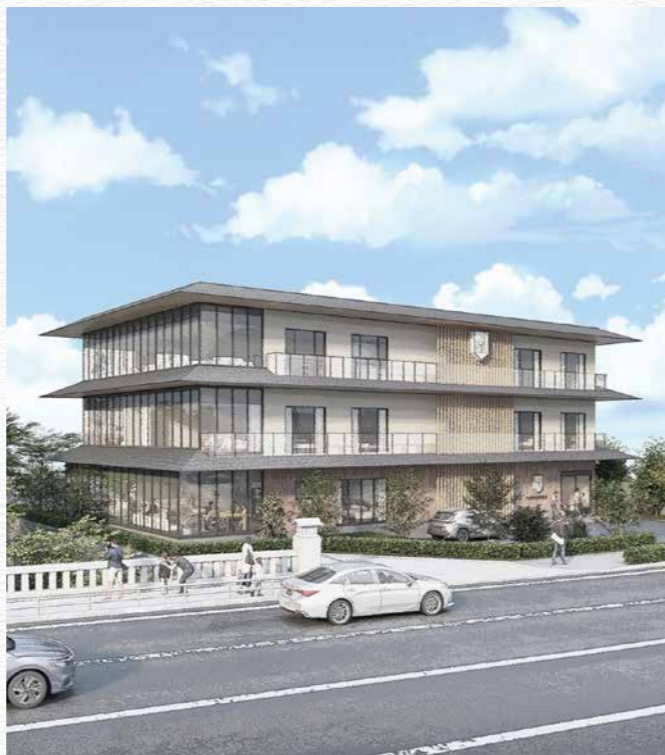
ドナルド・マクドナルド・ハウス京都 完成予想図

この地で暮らした了徳寺の 住職家族は、皇族の邸宅跡地 ある歴史や豊かに保たれた自 然環境から「個人で持つべきで はなく、公に返したい。公益の ために活用してほしい。」との 思いでした。住職家族は 2006年に癌を患い亡くな りますが、この思いに共鳴し、 支援に乗り出した弁護士グ ループが多くの困難を乗り越こ え2017年によくやく宗教 法人の清算を果たしました。遺 志を受け継ぎ「公益事業に利用 する事」を条件に、京都府、京 都市、真宗大谷派へ寄付を申し 入れ、2019年に真宗大谷 派へ所有権が移転されました。