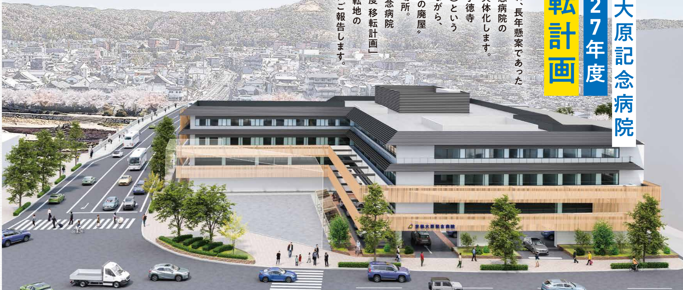
新病院完成予想図

良縁に恵まれ、長年懸案であった 京都大原記念病院の 移転計画が具体化します。 移転地は旧了徳寺 (旧伏見宮邸)という 歴史を持ちながら、 市内最大級の廃屋 と呼ばれた場所。 「京都大原記念病院 2027年度移転計画」 について、移転地の 背景とともにご報告します。