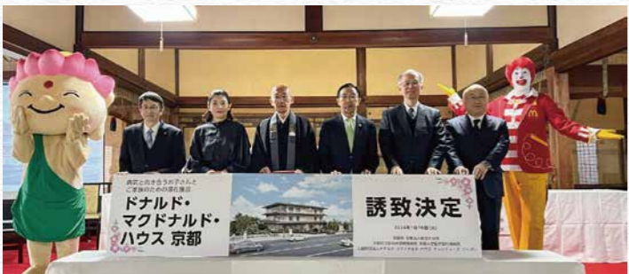
共同記者会見の様子

となるハウスの誘致が決定。 2024年1月の共同記者 会見で正式に発表されまし た。宗派は残りの土地につい てハウス事業との親和性を 念頭に医療・福祉施設を想定 した公募型プロポーザルを実 施。京都大原記念病院グルー プ(医療法人社団行陵会)が 京都大原記念病院の移転を 提案した結果、2023年 12月に優先交渉権者に決定 されました。