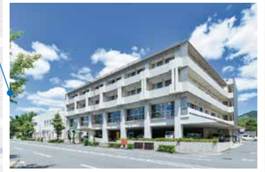
京都近衛リハビリテーション病院